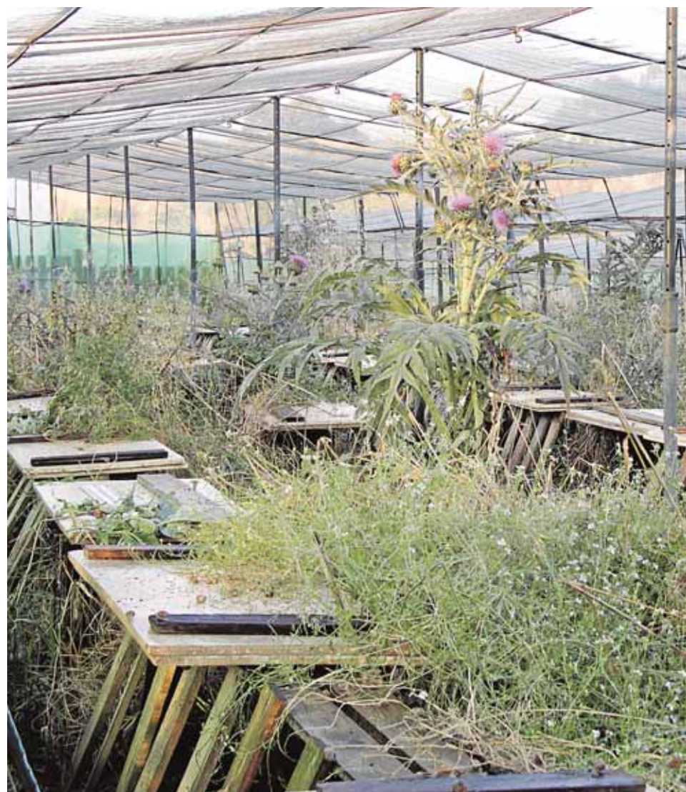
Las instalaciones de Puebla del Río han logrado un ambiente muy propicio para el