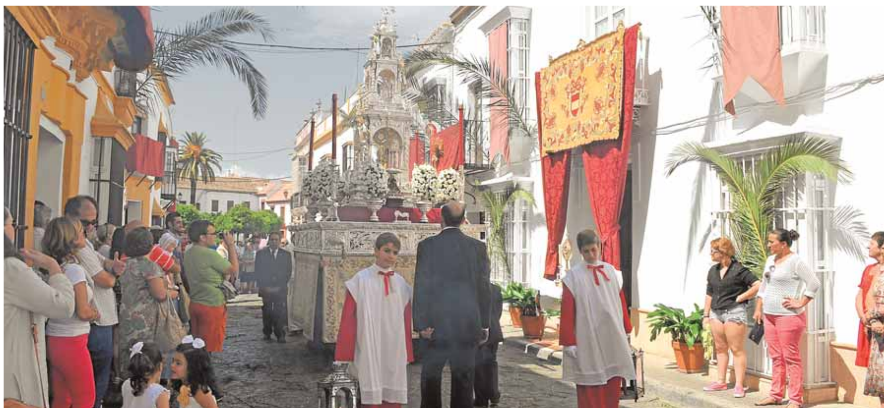
La procesión eucarística de Santa María es la más antigua de las tres que se celebran en Utrera

de licitación asciende a 1.062.467,87 euros (IVA incluido). El procedimiento de adjudicación es abierto. El plazo de presentación de ofertas permanecerá abierto hasta las 13:00 horas del 19 de junio en la Diputación Provincial de Sevilla. A.H.