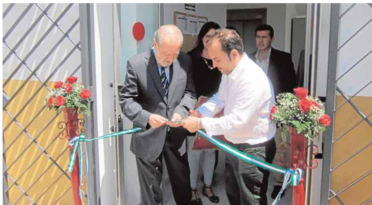
El presidente de la Diputación y el alcalde de La Algaba inaugurando el Centro «Las 17 rosas»

Este complejo puesto en funcionamiento desde hace poco más de un mes se constituyó como un centro cultural y educativo de referencia, con una amplia biblioteca municipal con sala de estudios para universitarios, un Centro de Interpretación del Agua, zona para residencias de compañías artísticas y un patio de entrada, escenario de numerosos espectáculos y eventos.