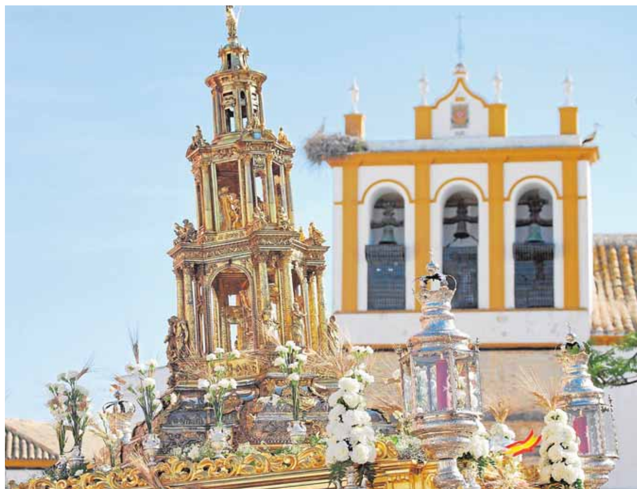
El Corpus Christi de Marchena es una de las fiestas más importantes de esta localidad de la Campiña

Jueves 4. Salida a las 9 horas desde la iglesia matriz de San Juan Bautista y recogida a las 12 horas