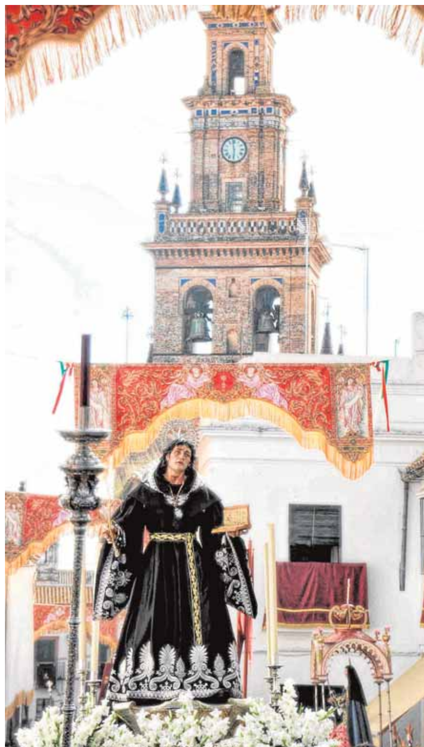
Imagen de San Teodomiro en el Corpus carmonense

La imagen de la Divina Pastora, de la hermandad de Nuestro Padre Jesús Nazareno partirá sobre las 20 en di-