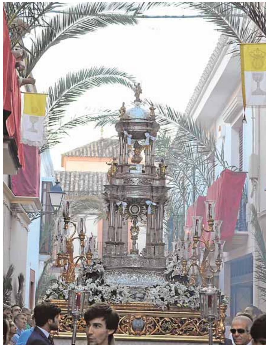
Una imagen del «Corpus chico» que sale de la iglesia de Santiago