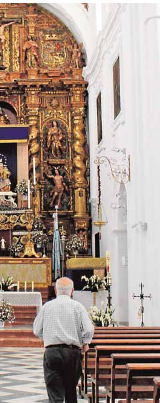
onio de Fuentes de Andalucía

parados. Por sexos, la mayor bajada se produce entre los hombres, cuya cifra de parados desciende desde los 262 registrados hasta los 249. En cuanto a las mujeres, la bajada en el número de desempleadas es sólo de dos personas, de las 214 a las 212.