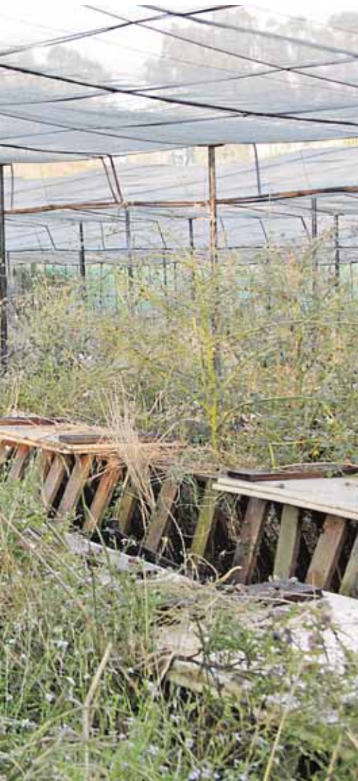
crecimiento de este tipo de caracol B.MORENO

sibilidades de futuro. Vecinos de Utrera, Algámitas, El Rubio, Gilena, Alcalá de Guadaíra se han animado a probar suerte con más ilusión que experiencia real en la cría del conocido como Helix Aspersa , una variedad de caracol comestible de gran tamaño, pero diferente a lo que se conoce como cabrilla .