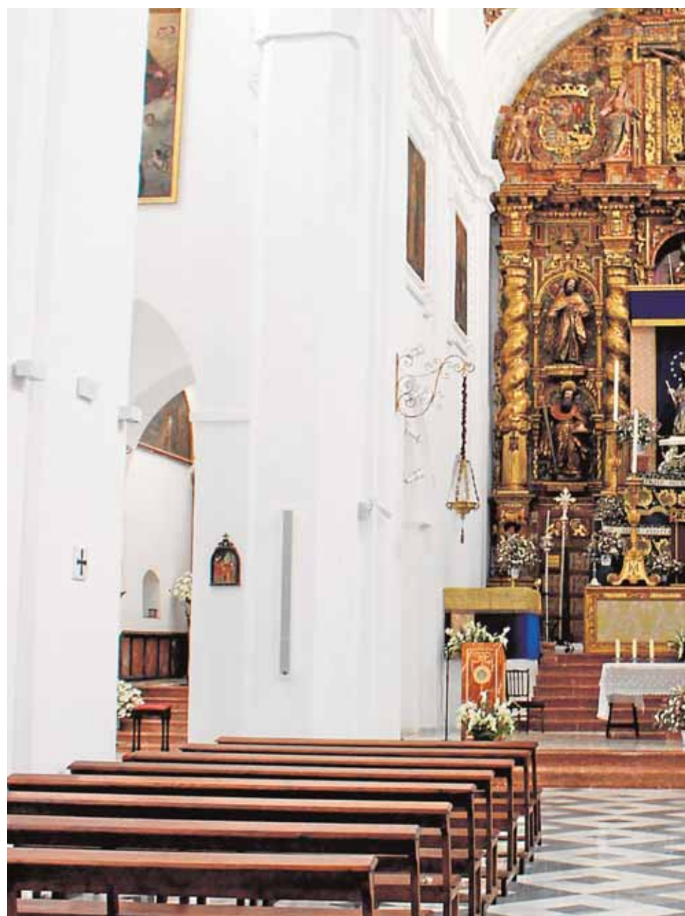
La rehabilitación del templo ha sido integral y ha conseguido revalorizar el patrimonio.