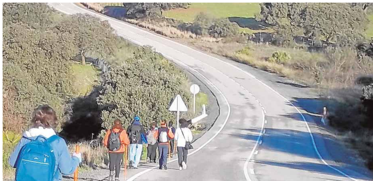
La modificación del trazado obliga a miles de peregrinos a transitar por el arcén de la carretera de Almadén J.C.R.